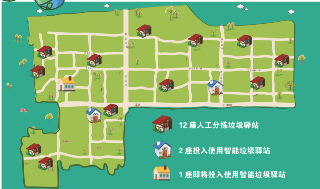
双井15座垃圾驿站点位图