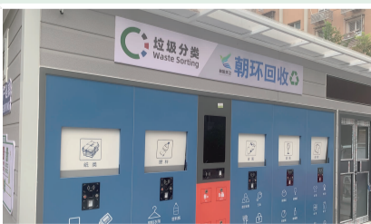
富力西社区新建智能垃圾驿站