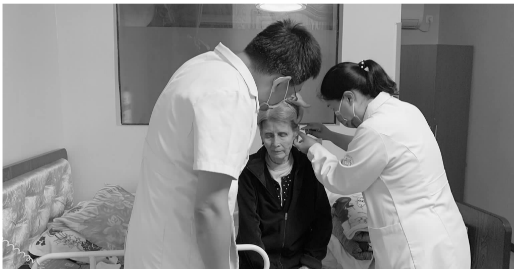
双井社区卫生服务中心医生为居民进行耳穴压丸