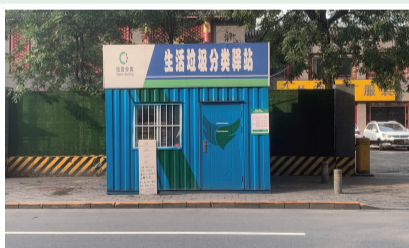
黄木厂社区垃圾驿站