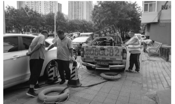
工作人员勘探下水管主管道