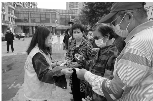
社区为居民发放绿地志愿者标志