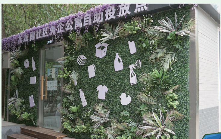
九龙南社区“智能+”垃圾驿站