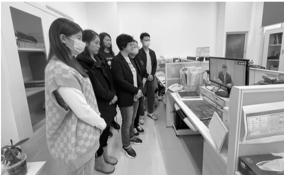
茂兴社区党支部党员 观看纪念辛亥革命110周年大会