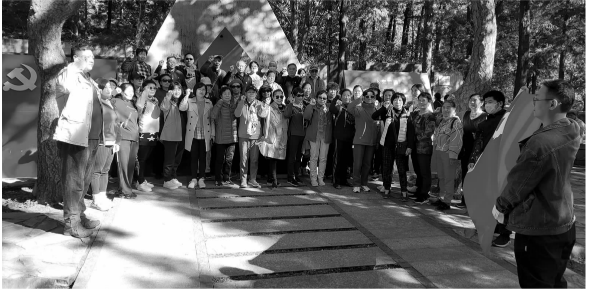
和平村一社区党员在“一二·九”纪念亭前重温入党誓词

广大党员干部纷纷表示抗美援朝为我国真正在世界上站稳脚跟、屹立于世界民族之林奠定了坚实的基础,更让我们这一代年轻人明白了今天的强大来之不易,将铭记历史,铭记先烈,倍加珍惜今天来之不易的幸福生活,在今后的工作中,要将理想信念付诸工作实践,立足岗位贡献力量。