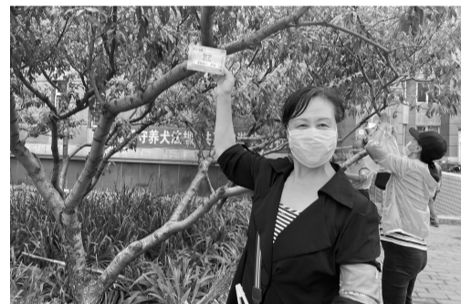
居民展示自己认领的社区绿地